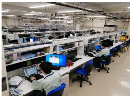
ソフト評価ブース