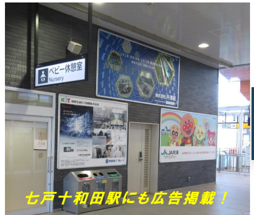
七戸十和田駅にも広告掲載！